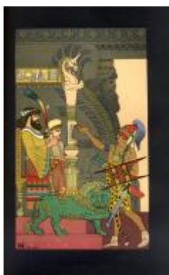
El embajador masageta ante Kambises