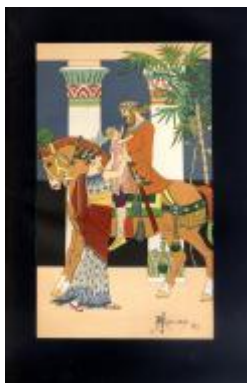
Despedida de Sappfó y Bardi

Fondo Arturo Mérida y Alinari (1882-1895): podemos leer las cartas que el artista recibió sobre asuntos del Ateneo, ahora digitalizadas en el archivo .